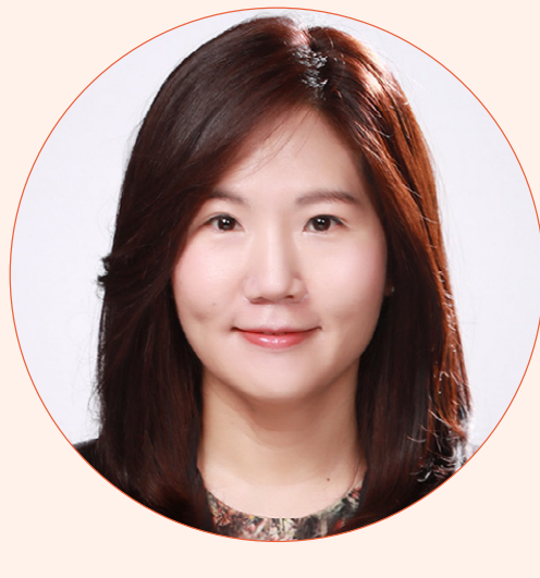
좌장 차기주 교수 가천대학교 유아교육학과